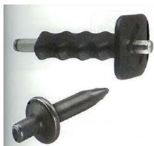
Монтажен инструмент SZE