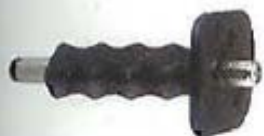
Монтажен инструмент SZE