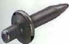
Набивен пирон ED